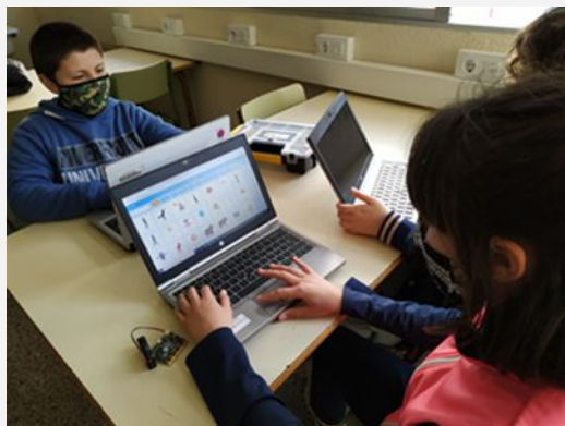
Extraescolars de robòtica de 4t a 6è