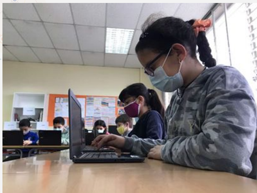
Tallers eines digitals en horari lectiu